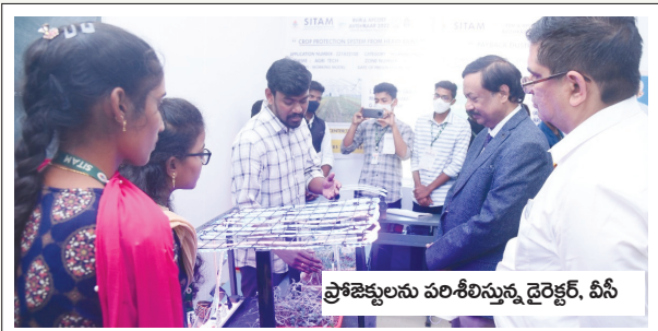
ప్రాజెక్టులను పరిశీలిస్తున్న డైరెక్టర్, వీసీ