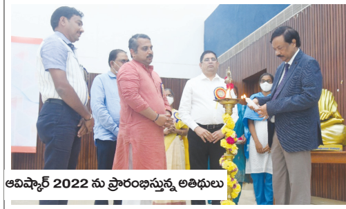
అవిష్కార 2022 ను ప్రారంభిస్తున్న అతిథులు