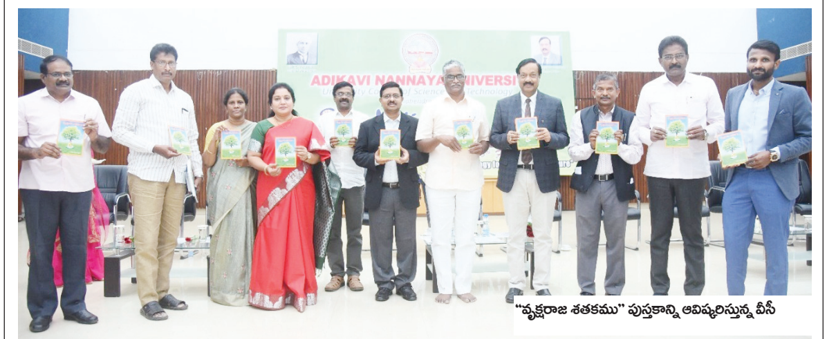
“వృక్షరాజ శతకము” పుస్తకాన్ని ఆవిష్కరిస్తున్న వీసీ